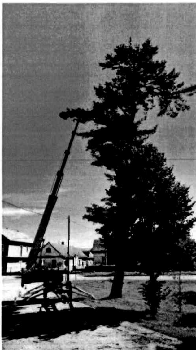
Uklanjanje gnijezda uz pomoć hidraulične korpe.