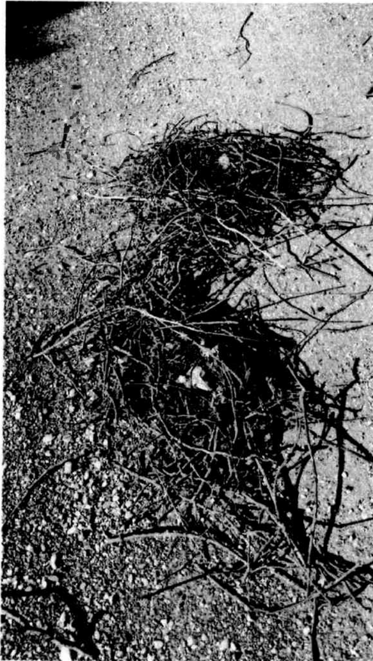
Skinuta gnijezda vrana