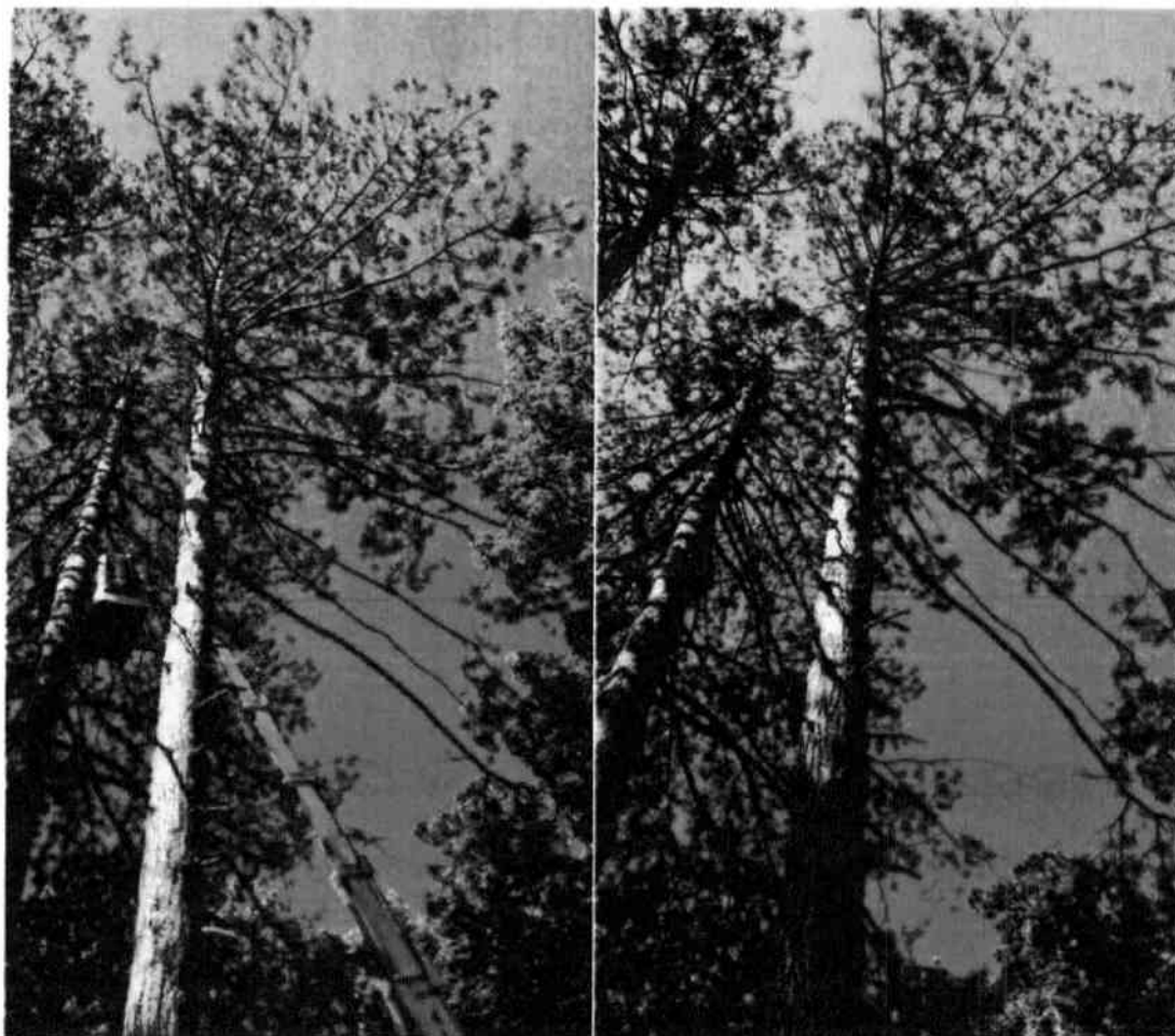
Stablo crnog bora prije i nakon skidanja gniježda.