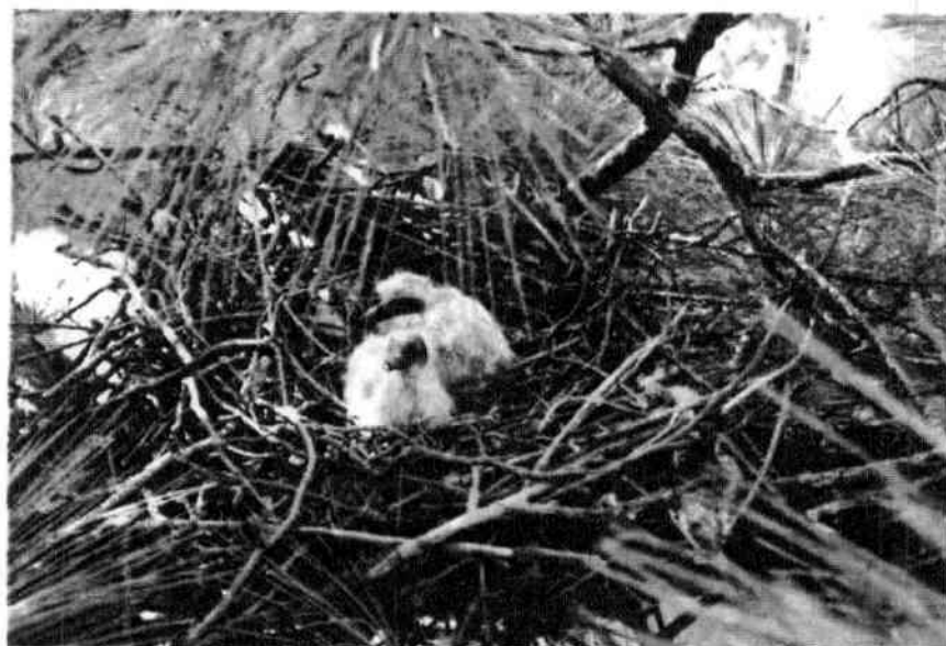
Ptići goluba divljeg grivnjaša u gnijezdu.