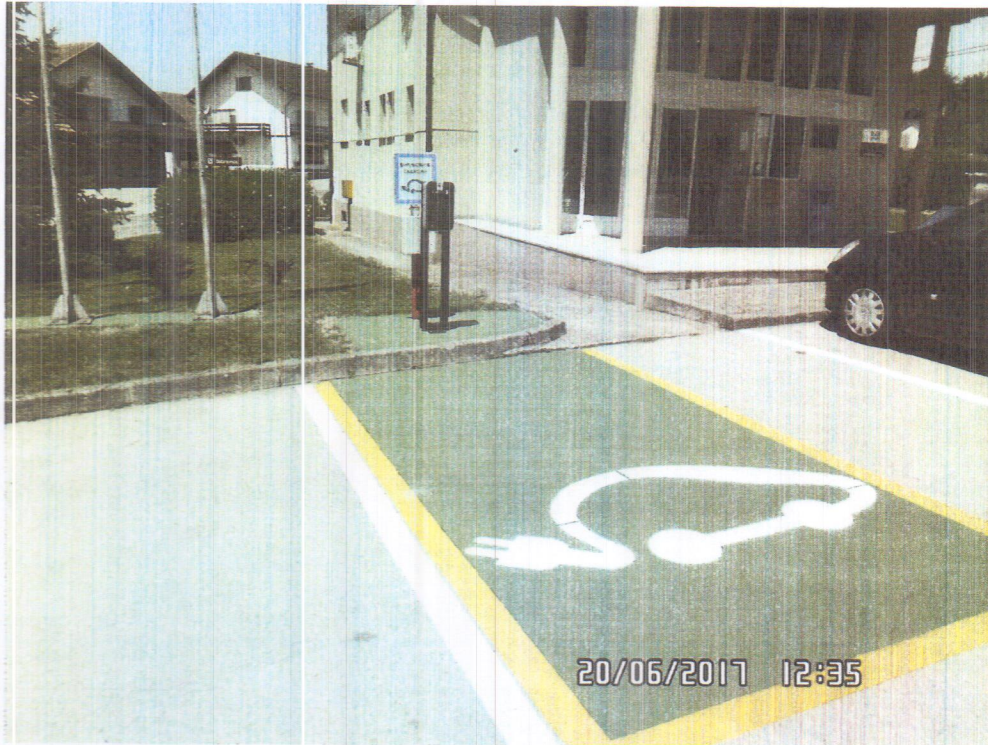
Slika 3. E- Punionica