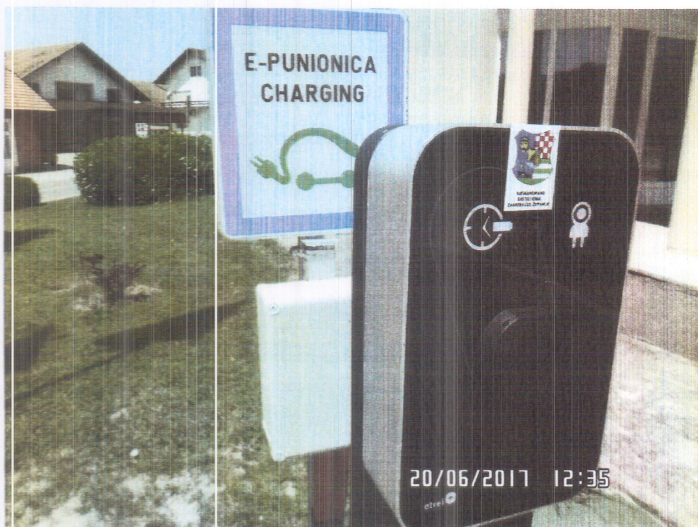
Slika 4. E- Punionica